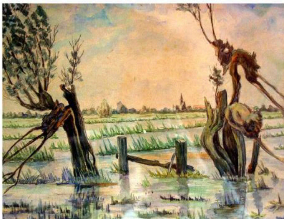
Inundatie door de bezetter van de Kortland- en Kleinpolder (met Rijskade en v.m. RK-kerk), Piet de Graaff, 1944 of 1945 (collectie HVN)

1/3, 5/4, 3/5, 7/6, 5/7, 2/8, 6/9, 13/9 (OMD), 4/10, 1/11 en 6/12